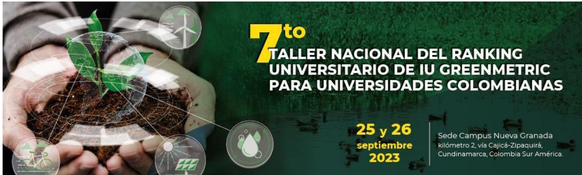
Figura 7. Publicidad del evento “7th Workshop Nacional del Ranking Universitario del UI GreenMetric para Universidades Colombianas”, los días 25 y 26 de septiembre del 2023.

3) Se realizó el aporte para la Memoria sobre el evento del 7th Workshop National UI Greenmetric World University Ranking, días 25 y 26 de septiembre.