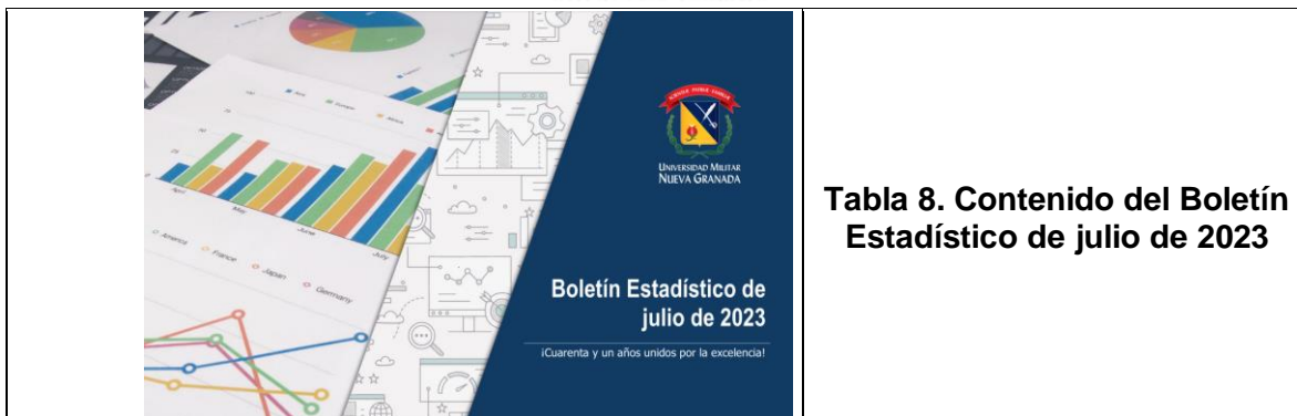
Tabla 8. Contenido del Boletín Estadístico de julio de 2023