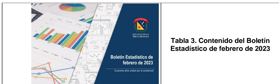
Tabla 3. Contenido del Boletín Estadístico de febrero de 2023