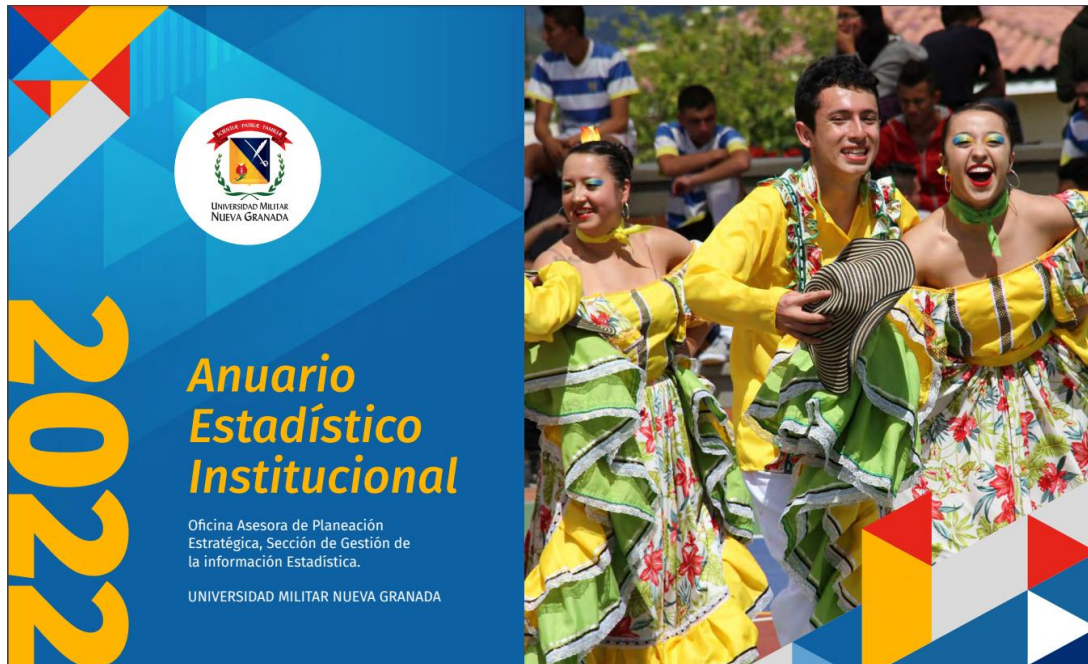
Figura 3. Portada del Anuario estadístico Institucional 2022

3) De la Fase 2 de la Rendición de Cuentas, se publicó 18/10/2023, el Informe de Sostenibilidad Institucional 2022 en la editorial Neogranadina