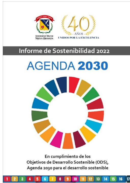
Figura 4. Portada del Informe de sostenibilidad 2022 (DOI: https://doi.org/10.18359/docinst.6995 )