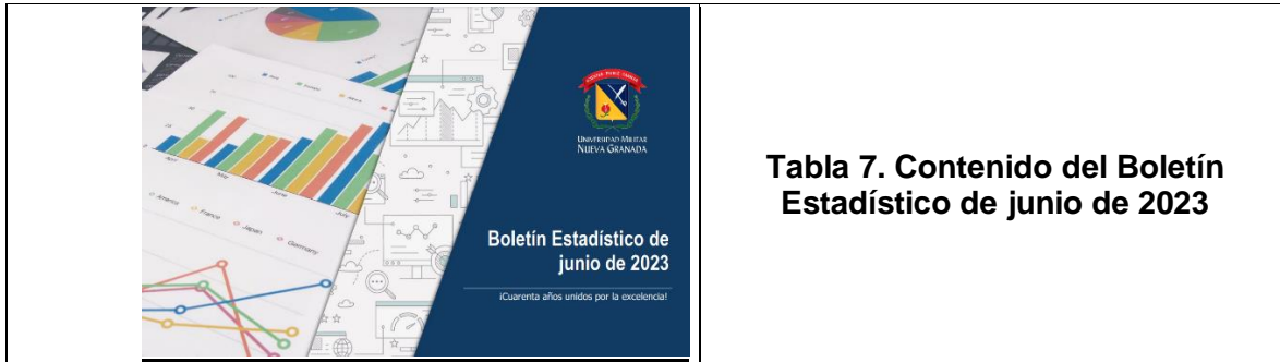
Tabla 7. Contenido del Boletín Estadístico de junio de 2023