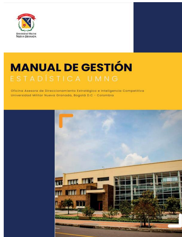
Figura 2. Manual de Gestión Estadística UMNG. (2021). Documento Institucional.

Complementando el anterior documento mencionado, se encuentra el Manual de Política Institucional , que incluye las características y condiciones con las que cuenta la institución para la adecuada gestión de sus estadísticas desde cada una de las tareas administrativas, de tal manera que se garantice la transparencia de la información, que tuvo como objetivo la consolidación de los lineamientos para la administración de cifras institucionales, permitiendo una alineación eficiente y eficaz de la información estadística.