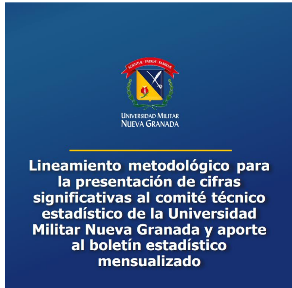
Figura 5. Portada del documento de Lineamiento metodológico para la presentación de cifras significativas al comité técnico estadístico de la Universidad Militar Nueva Granada y aporte al boletín estadístico mensualizado.

Es importante mencionar que se cuenta con el documento con el lineamiento metodológico para la presentación de cifras significativas al Comité Técnico Estadístico de la Universidad Militar Nueva Granada y aporte al boletín estadístico mensualizado, el cual se invita a interiorizar y la plantilla para los aportes en archivo Word desde el año 2022.