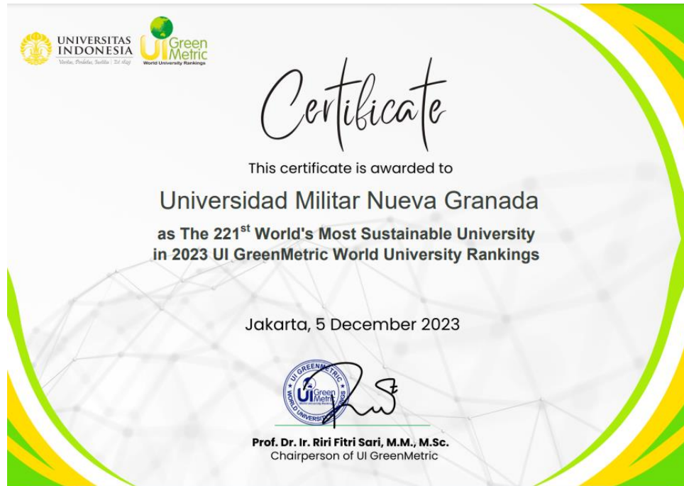
Figura 8. Certificado y resultado adjudicado a la Universidad Militar Nueva Granada por la participación por el reporte en el IU GreenMetric Ranking.