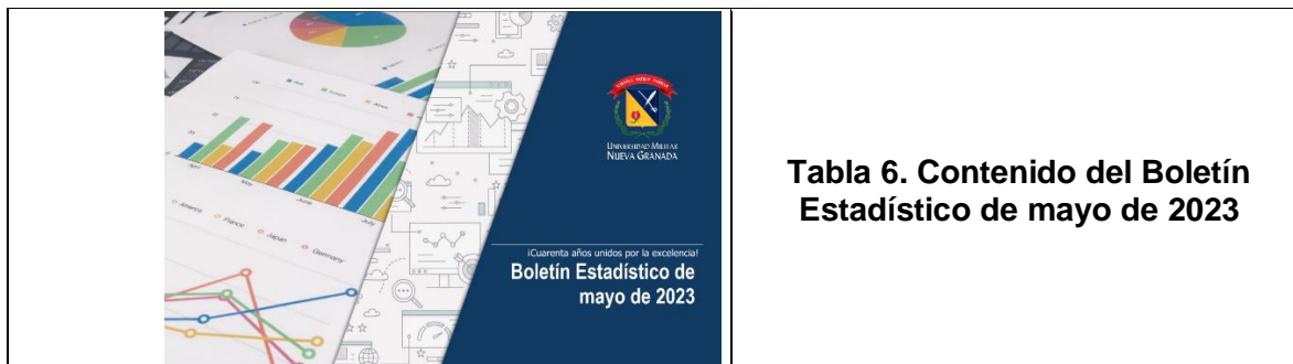
Tabla 6. Contenido del Boletín Estadístico de mayo de 2023