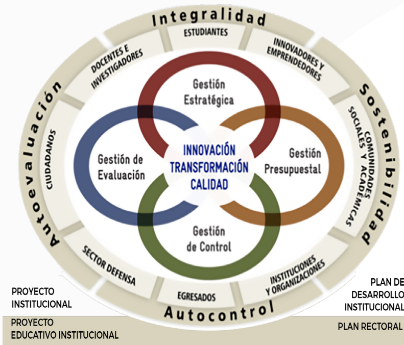
Figura 1. Sistema de direccionamiento estratégico del PI actual