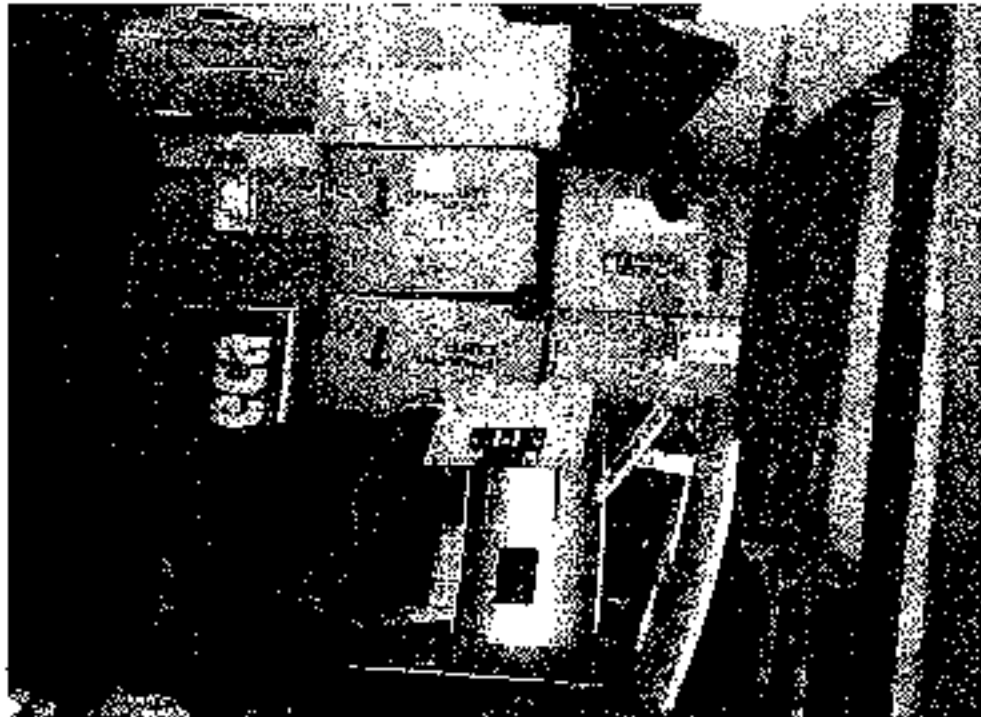
Facultad de Medicina – Equipos de cómputo y material bibliográfico

artículos: Art. 26 Control Inventario Libros y Art. 47 "Baja de bienes transferidos a Entidades Gubernamentales con propiedad de bienes no necesarios", debieron ser tenidos en cuenta, toda vez que están claros para el trámite y no se entiende las razones de tropiezos innecesarios y justificaciones infundadas dadas a los encargados, que no han dado lugar a soluciones, generando cifras de balance, no ajustadas a la realidad.