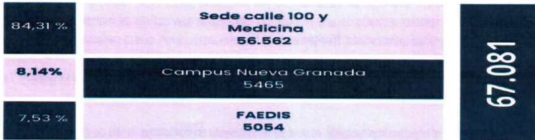
(figura n.º. 1)

Además, destacó que, en consonancia con el Acuerdo n.º. 01 de 2022, que establece la estructura organizacional de la Universidad Militar Nueva Granada y modifica la estructura académico-administrativa. Posteriormente, resaltó que mediante la Resolución Rectoral n.º. 0590 del 18 de julio de 2022, en la cual se establece y desarrolla la Estructura Académico-Administrativa de la Universidad Militar Nueva Granada, se adiciona la palabra "egresados" en el organigrama de la División de Medio Universitario, Extensión y Proyección Social de la Vicerrectoría Campus Nueva Granada. (ver figura n.º. 2)