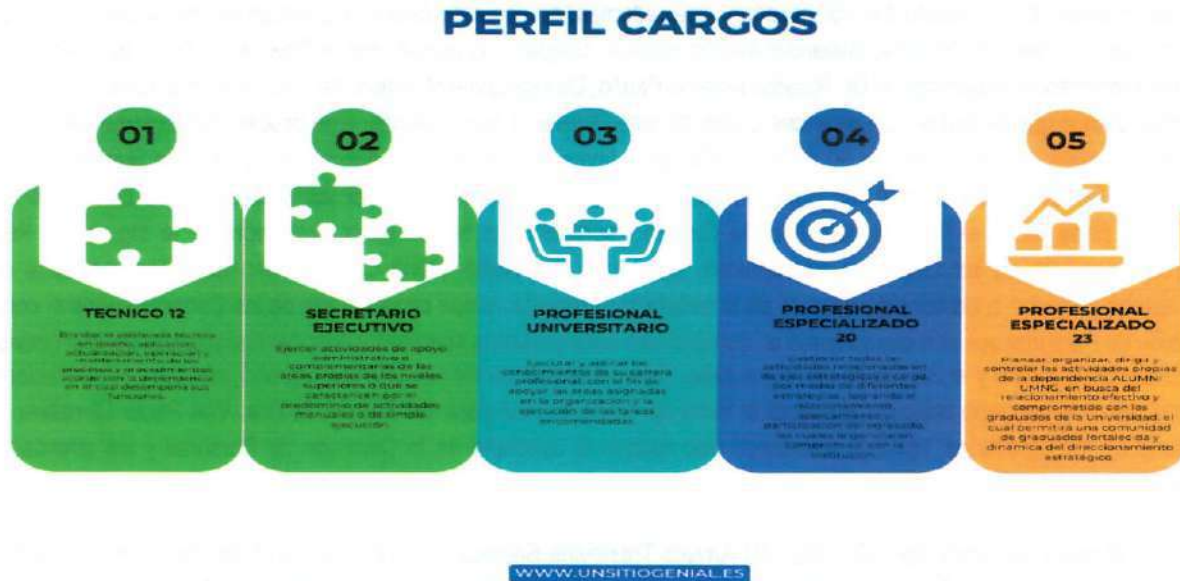
(figura n.º. 1)