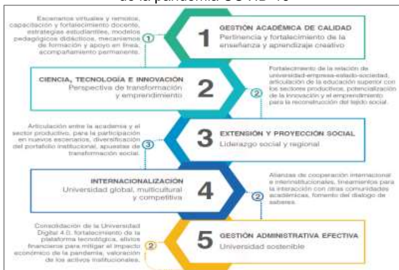
Gráfico No. 3. - Objetivos estratégicos del Plan de Desarrollo 2020-2030 en el escenario de la pandemia COVID-19

Fuente: Documento Plan de Desarrollo Institucional 2020-2030 UMNG.