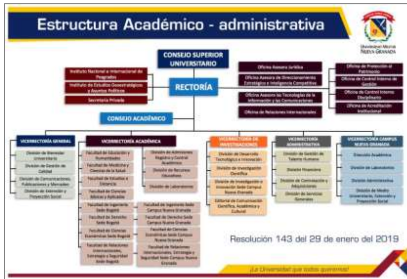
Gráfico No. 1. - Estructura UMNG