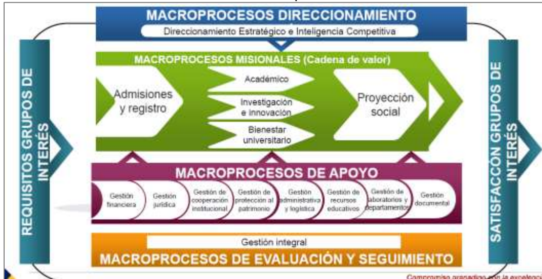
Gráfico No. 2. - Macroprocesos UMNG

La UMNG cuenta con macroprocesos de direccionamiento, misionales, de apoyo y de evaluación y seguimiento, requeridos en su funcionamiento. A continuación, se muestra el mapa de macroprocesos de la universidad.