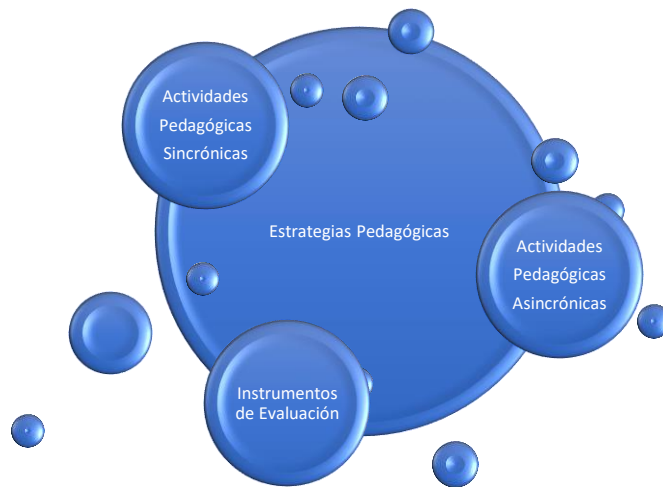
Figura 3 Relación de Estrategias Pedagógicas, actividades académicas e instrumentos de evaluación en el Programa de Derecho

En consecuencia, las estrategias pedagógicas y didácticas se articulan con los instrumentos de evaluación, lo que conlleva a que se escojan instrumentos que estén contextualizados con la realidad, que promuevan la investigación y la creatividad, así como el pensamiento crítico, el trabajo colaborativo y el respeto por sí mismo y los demás. El objetivo de la evaluación es dar herramientas para promover el mejoramiento continuo del aprendizaje para aprender a aprender y aprender para toda la vida.