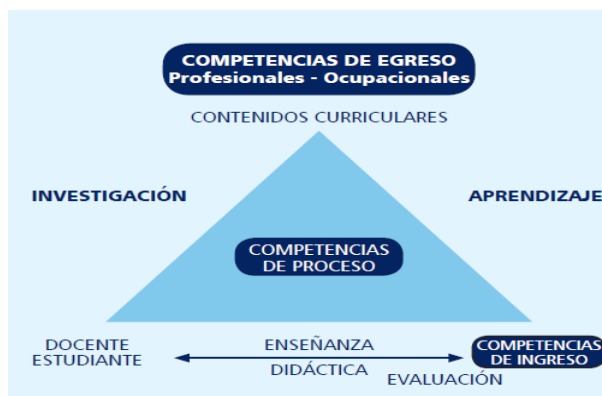
Figura 1 Protagonistas Relación Pedagógica Modelo Educativo UMNG

De igual manera, el modelo pedagógico de la UMNG establece que la relación pedagógica tiene como protagonistas del proceso educativo al docente y al estudiante, cuya finalidad es el proceso de formación del ser humano.