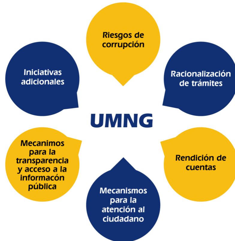
Figura 1. Componentes básicos para la construcción del Plan Anticorrupción, Atención y Participación Ciudadana (tomado de Presidencia de la República, 2015, p. 11)

Con el propósito de suplir tal necesidad señalada en las normas citadas, la Universidad Militar Nueva Granada (UMNG) refleja su compromiso al suscribir el presente Plan Anticorrupción, Atención y Participación Ciudadana, asumiendo su responsabilidad como actor de una gestión pública transparente, al igual que abierta a sus grupos de interés y la ciudadanía en general. En este sentido, y en coherencia con la metodología denominada «Estrategias para la construcción del Plan Anticorrupción y de Atención al Ciudadano» (Presidencia de la República, 2015), en su segunda versión se establecen seis pilares básicos (figura 1):