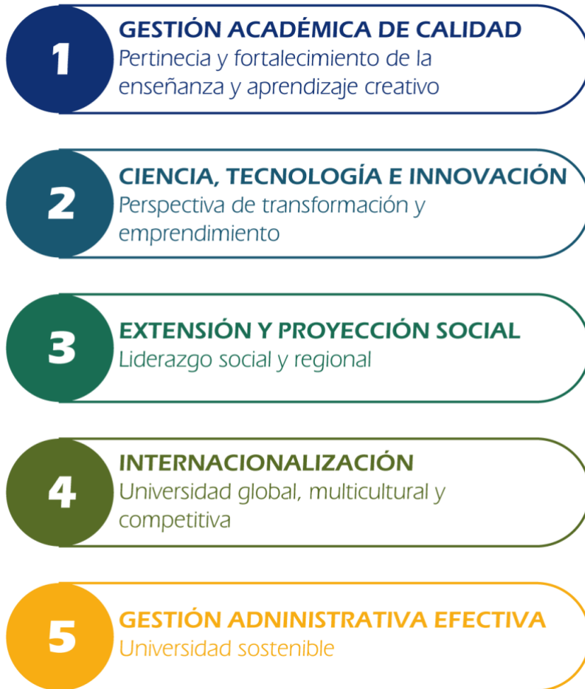
Figura 2. Objetivos estratégicos institucionales establecidos en el «Plan de Desarrollo Institucional “Equidad sostenible con la excelencia” 2020 - 2030» (Universidad Militar Nueva Granada, 2020b)